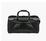
Noir Black WKAAGTBL1021