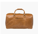
Tan Tan WKAAGT001113